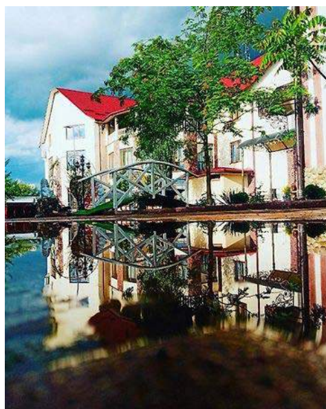
Рис.5. Готель «Під Явором»

Готель «Під Явором» цей готель має чудове розташування яке допомагає йому розвинути анімаційну діяльність, тому що готель розміщується недалеко від центру міста і знаходиться недалеко від острова кохання.