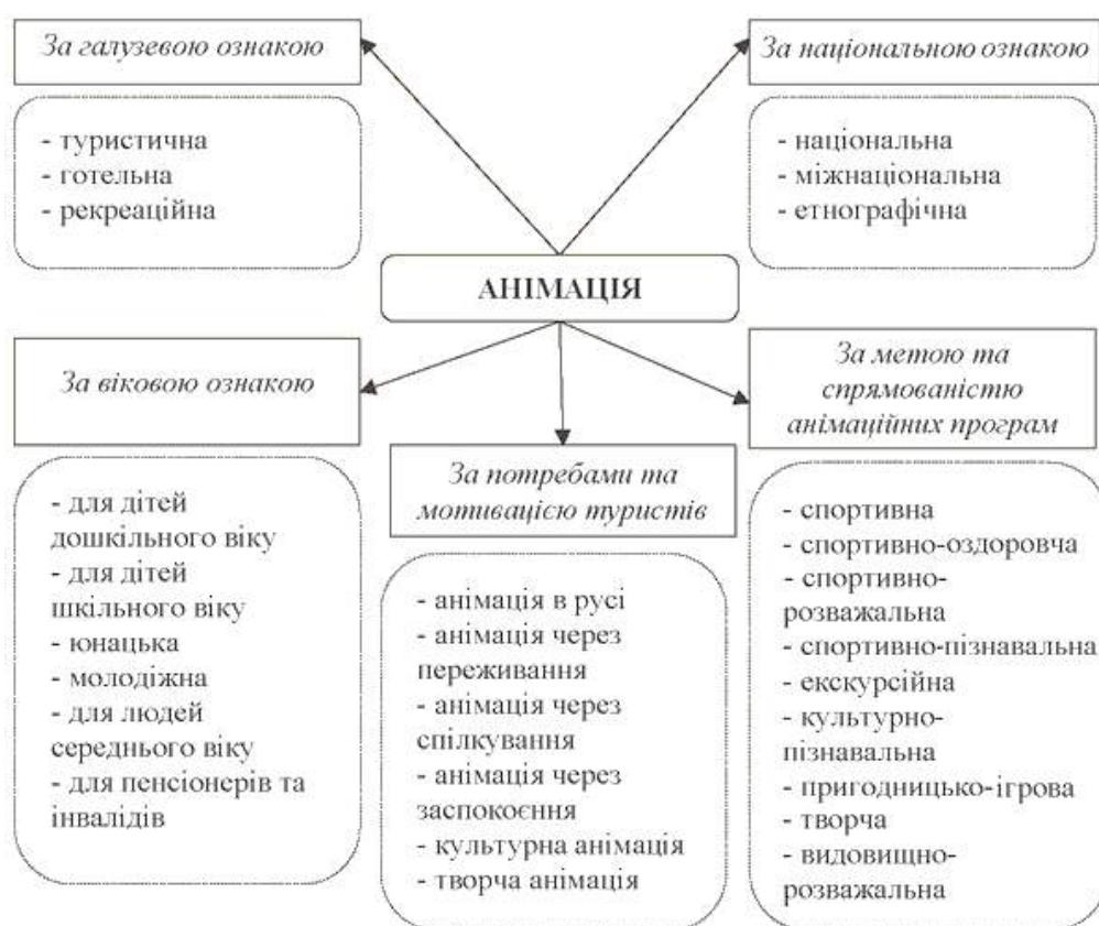
Рис. 4. Класифікація анімації[9, ст52]

Створення умов для належного розвитку анімації на підприємствах туристичної індустрії це категорія успішності та чудового методу стимулювання уваги все більшої кількості відпочиваючих.