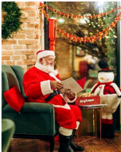
Рис. 7. Анімація в кав'ярні «Кавоварка» м. Івано-Франківськ

Отже, в закладах ресторанного типу анімація представлена здебільшого тимчасовим наймом аніматора на період свят чи тематичних заходів, також важливим елементом анімації в ресторанах виступає оформлення закладів, яке використовують в залежності від цікавих українських та закордонних свят чи пір року, наприклад: «Halloween. », Valentine's Day», «Великдень» та інші.