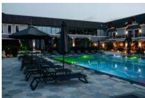
Рис. 6. «Underhill Resort&Spa»