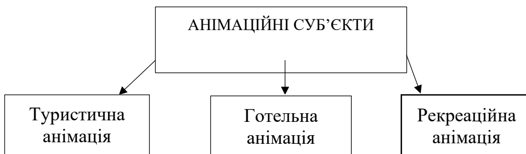
Рис. 3. Схема анімаційних суб'єктів

Анімацію можна поділити на суб'єкти які залучені у всіх підприємствах туристичної індустрії і відіграють важливі чинники у них.