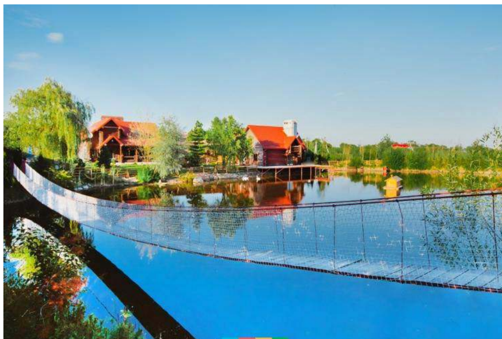
Рис.6. Ресторан «Фезенда»

Із закладів харчування, можна виділити ресторан «Фезенда» це один із популярних закладів в місті, цей заклад пропонує різноманітні атракціони, розваги для дітей і чудове прикрашене подвір'я для фотозйомок в будь яку пору року.