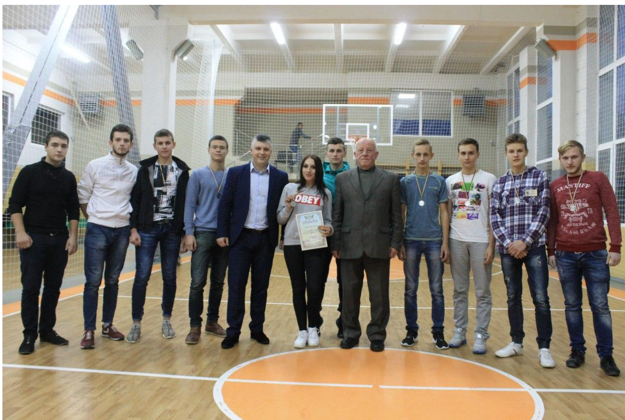
Спартакіада, 4 листопада 2016 р.