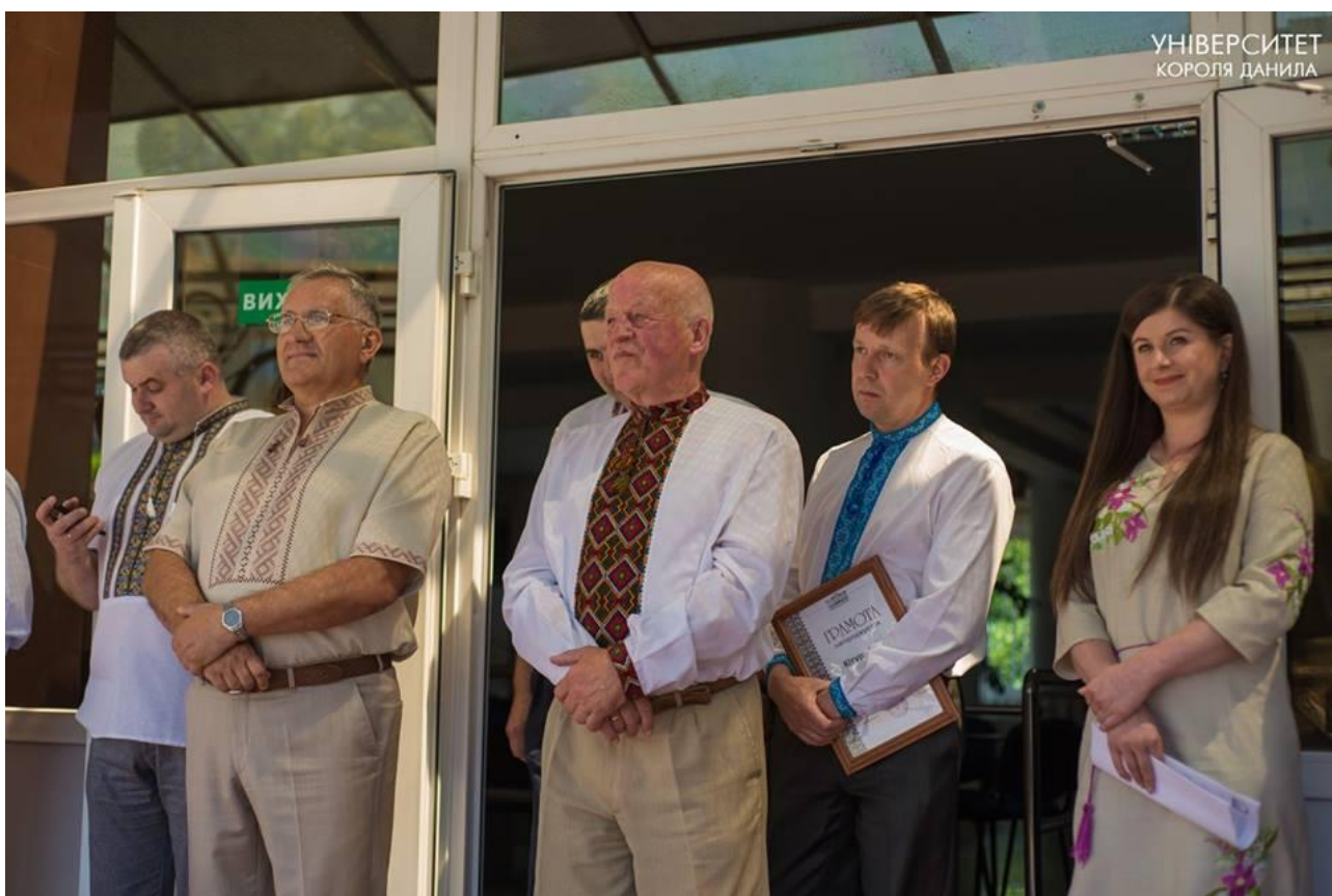
Вручення дипломів, 7 липня 2017 р.