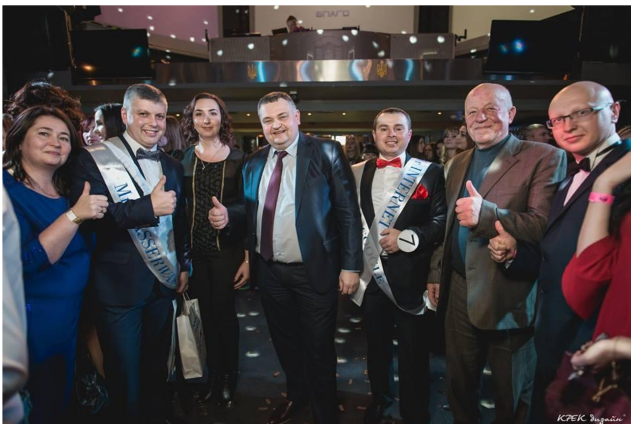
З переможцями та вболівальниками конкурсу «Міс і містер університету», 24 листопада 2016 р.