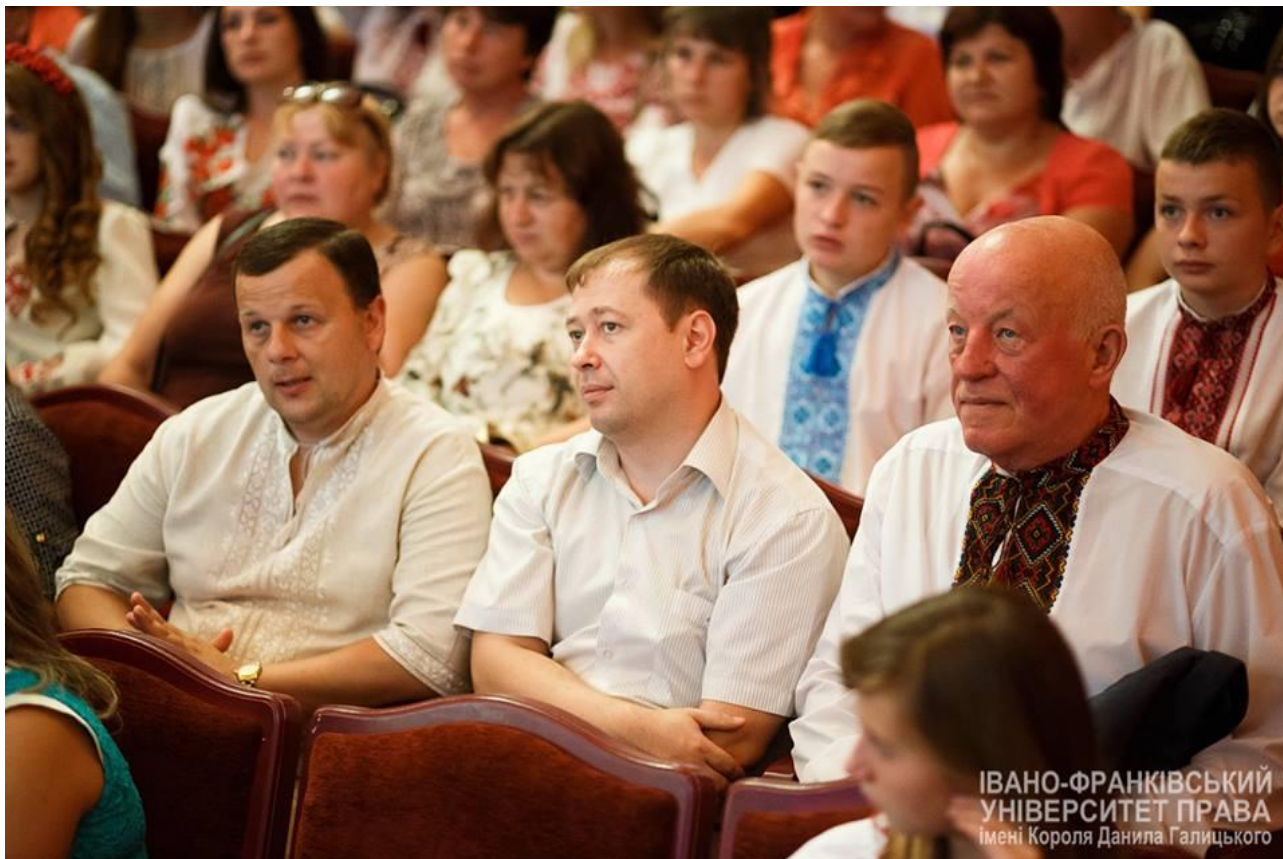
20 жовтня 2016 р.