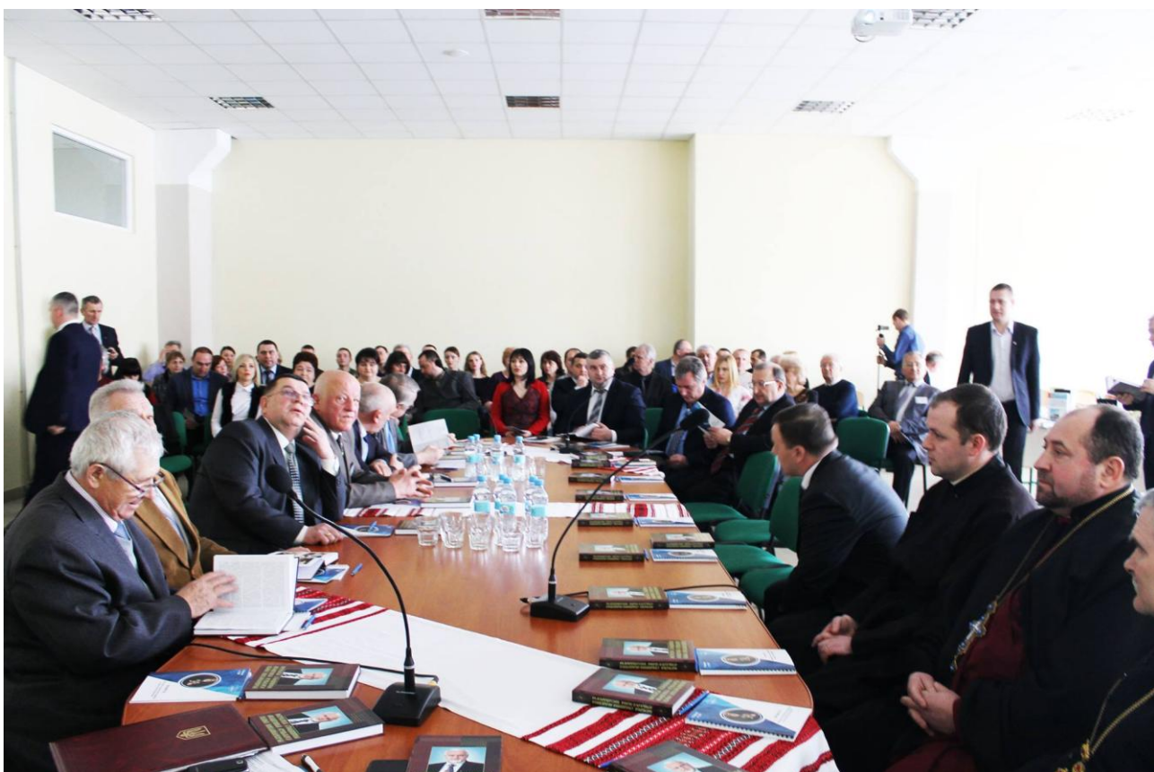
Участь у круглому столі на тему «Життєвий та творчий шлях Академіка Луцького Івана Михайловича, присвячену річниці від дня народження засновникаПВНЗ Університету Короля Данила, 7 березня 2017 року