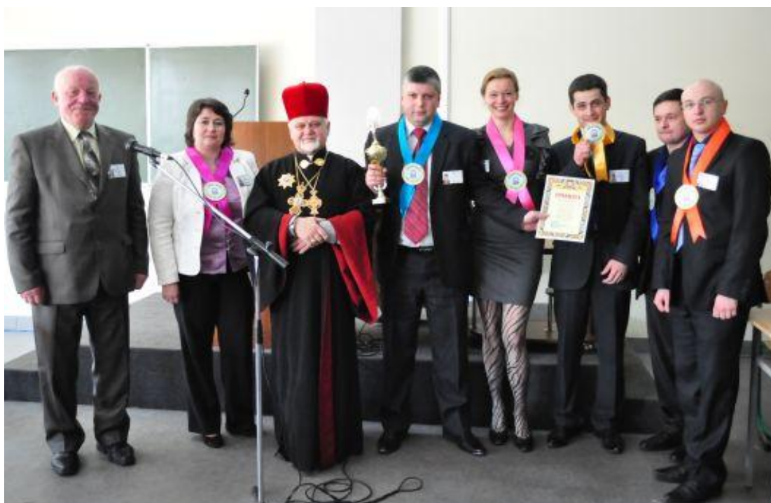
(Інтелектуальний турнір «Що? Де? Коли?») 28 жовтня 2012 р.