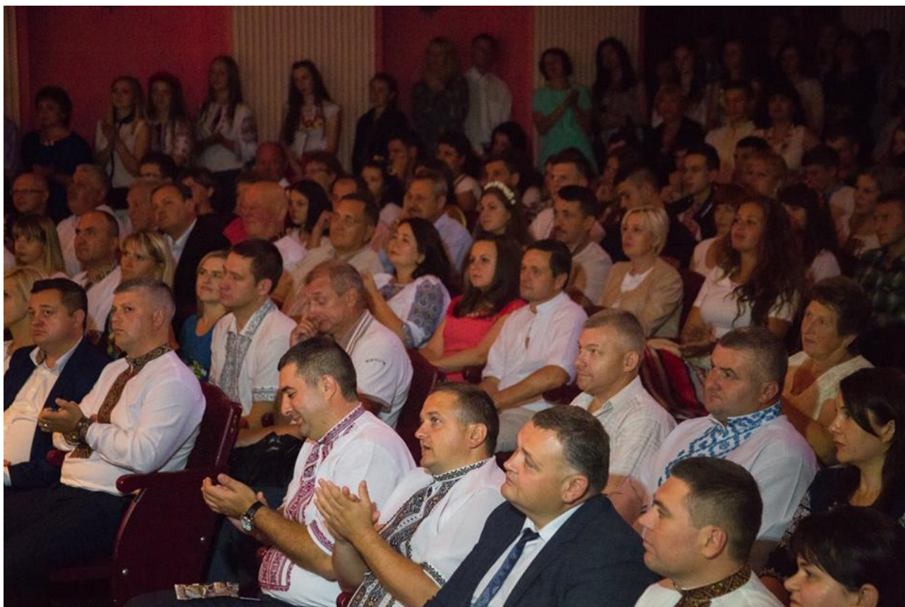
День знань. Обласна філармонія, 1 вересня 2016 р.