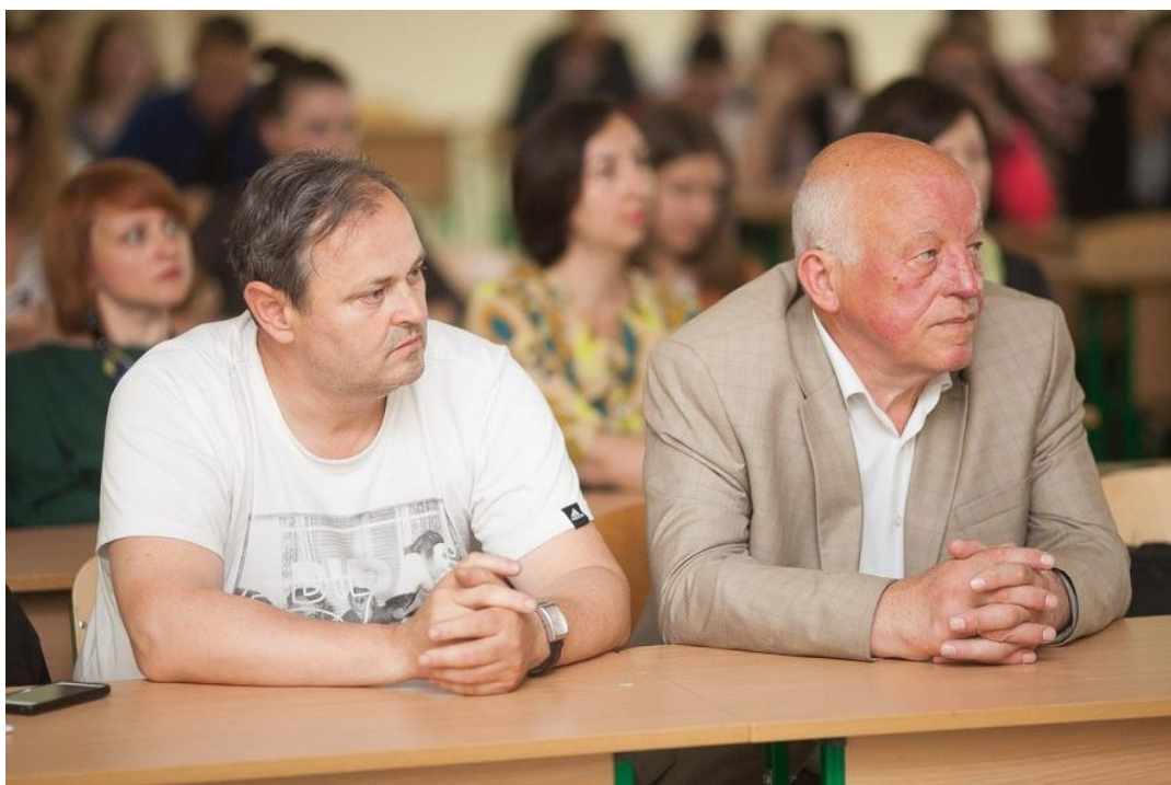
На звітній викладацькій та студентській науково-практичній конференції «Наука та освіта XXI століття», 21 квітня 2016 р.