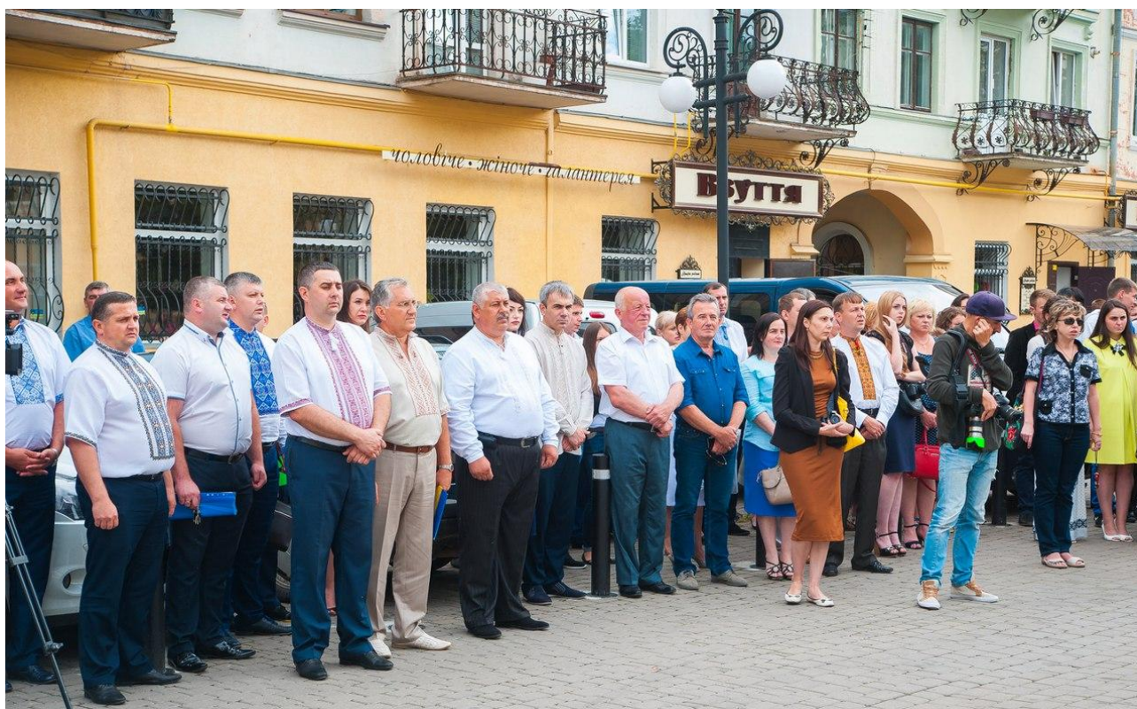
Площа Шептицького. З професорсько-викладацьким складом на церемонії вручення дипломів 7 липня 2016 р.