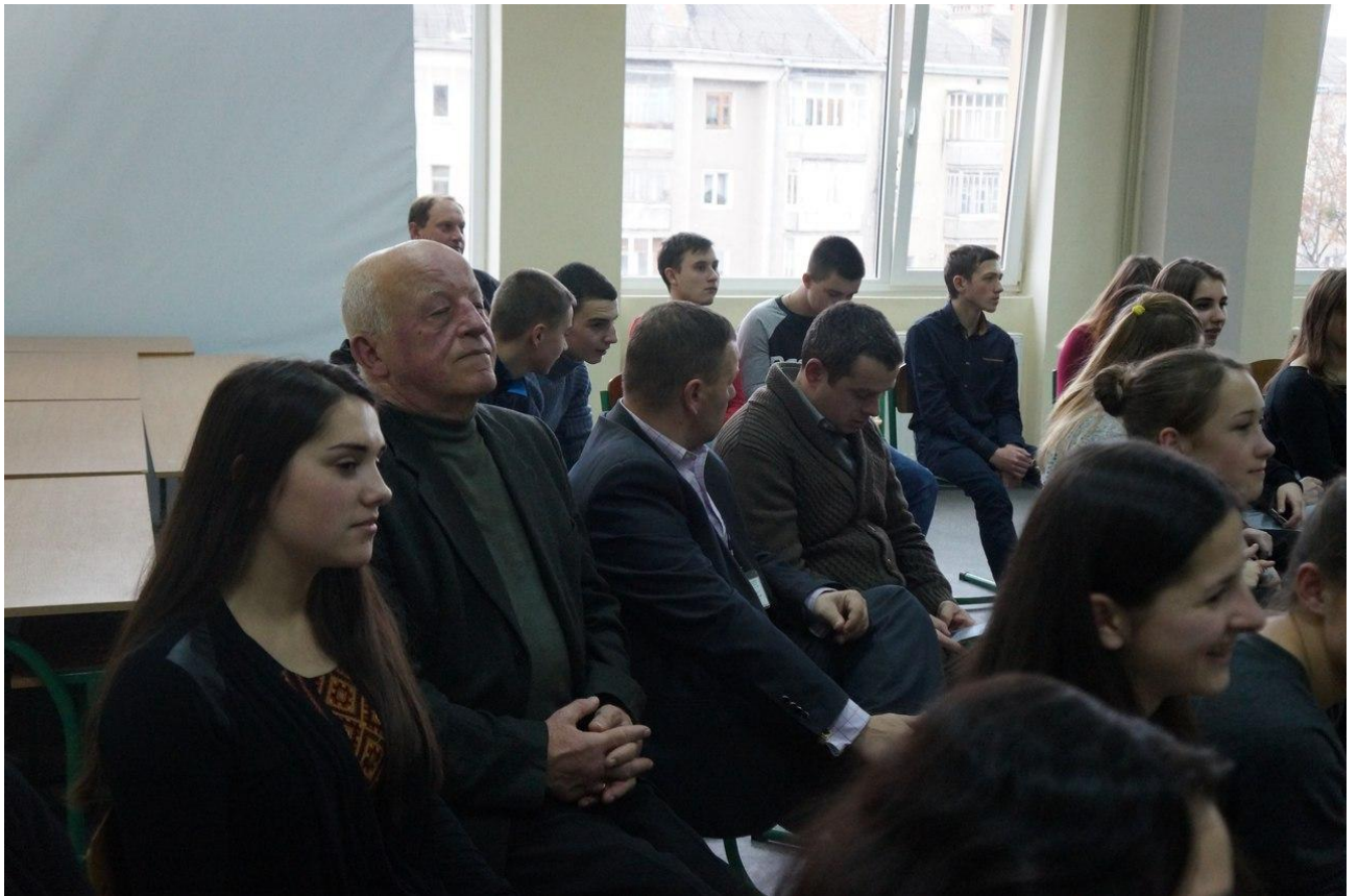
На засіданні III круглого столу «Студентські наукові дискусії поза форматом: архітектура, економіка, право», 14 квітня 2016 р.