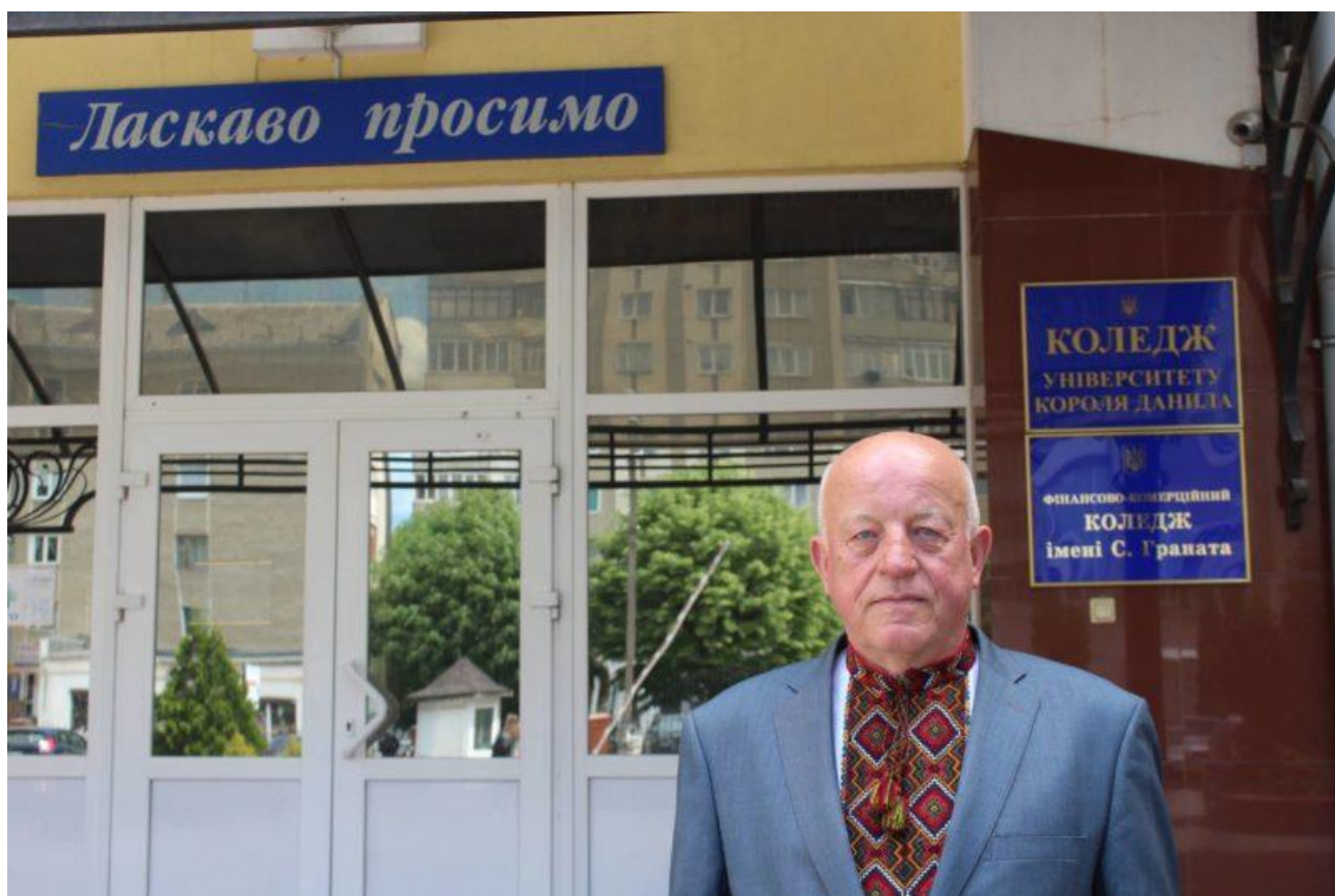
Перед входом в університет, 2018 рік