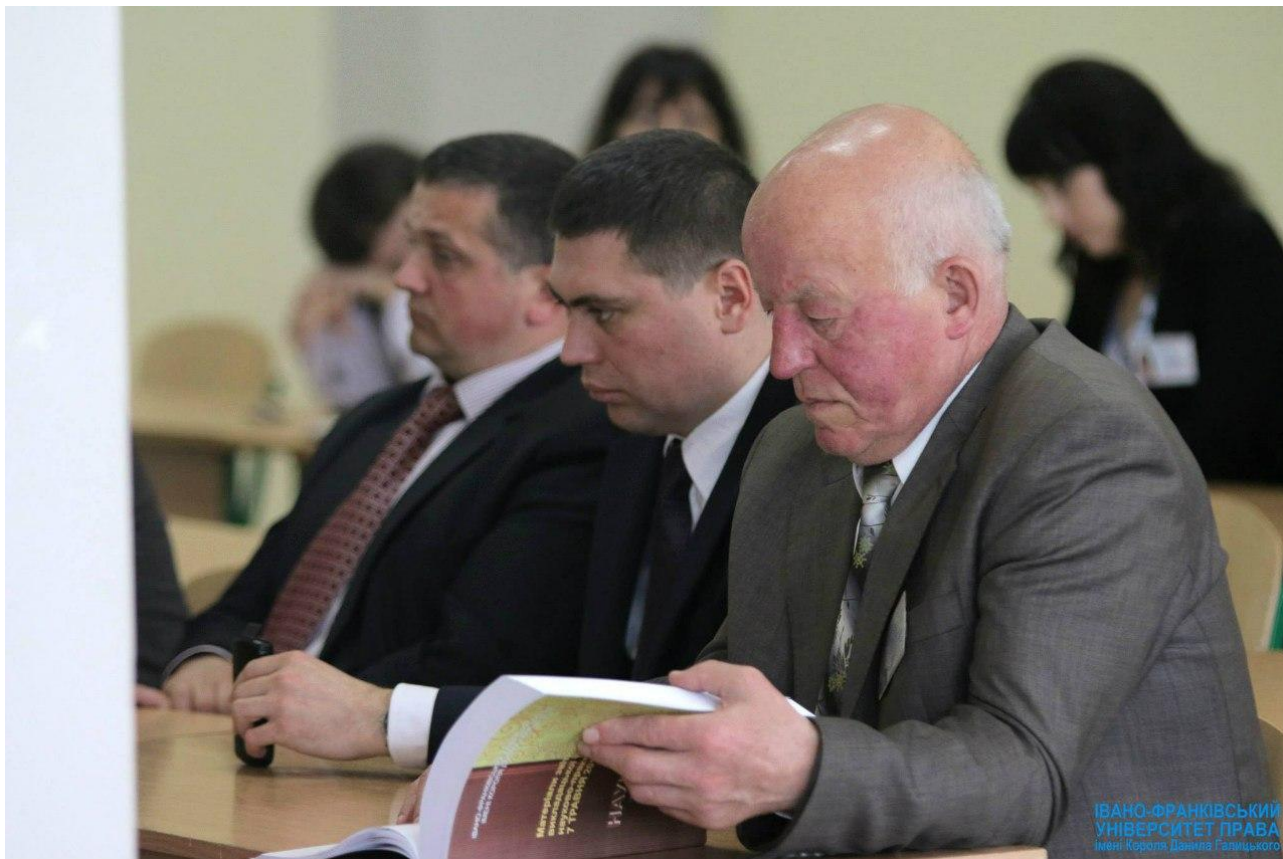
На звітній викладацькій та студентській науково-практичній конференції «Наука та освіта XXI століття», 7 травня 2015 р.