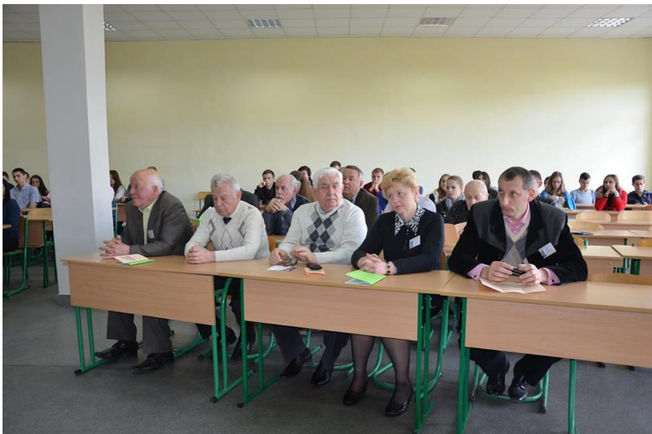
Серед учасників IV Міжнародного студентського наукового симпозіуму «Співдружність наук: архітектура, економіка, право», 18 листопада 2016 р.