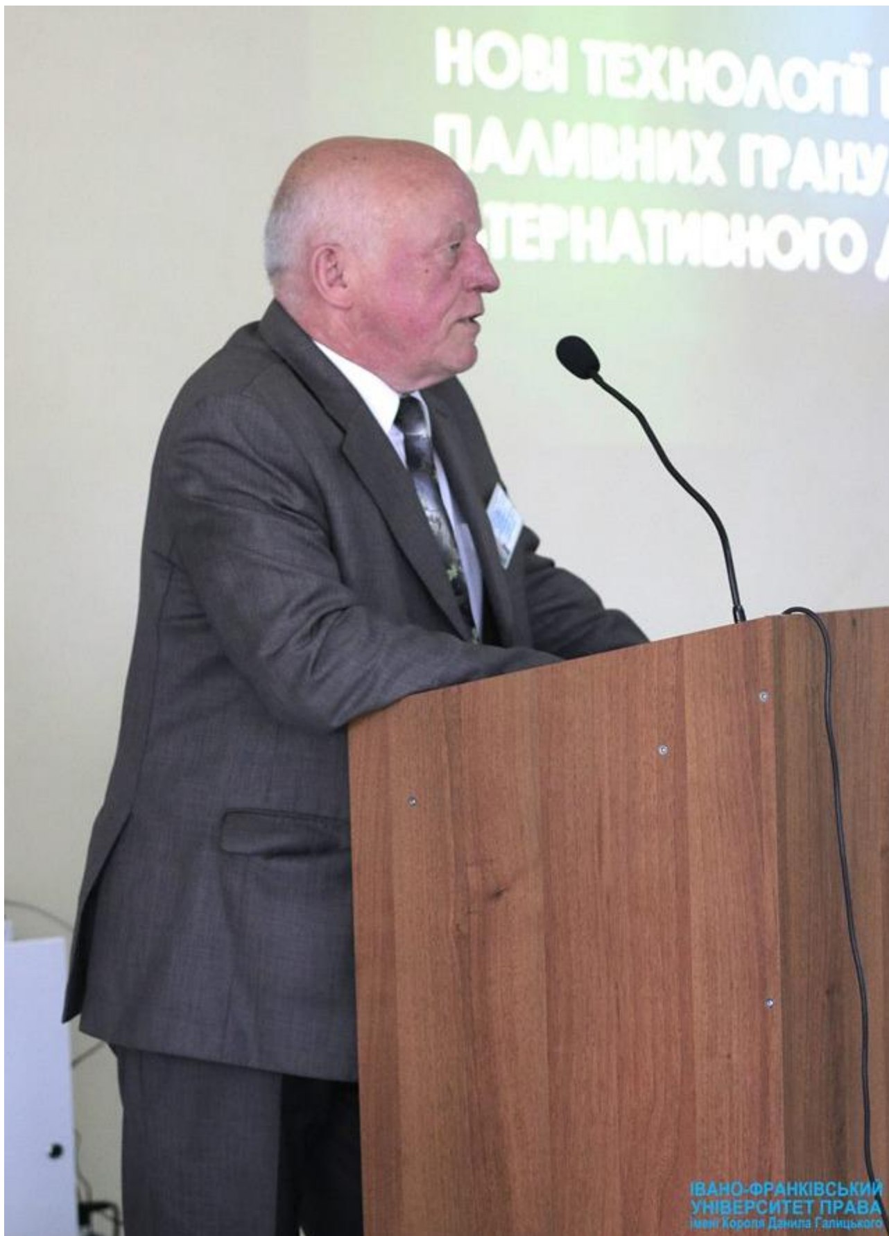
Виступ на пленарному засіданні в ході звітної викладацької та студентської науково-практичної конференції «Наука та освіта XXI століття», 7 травня 2015 року.