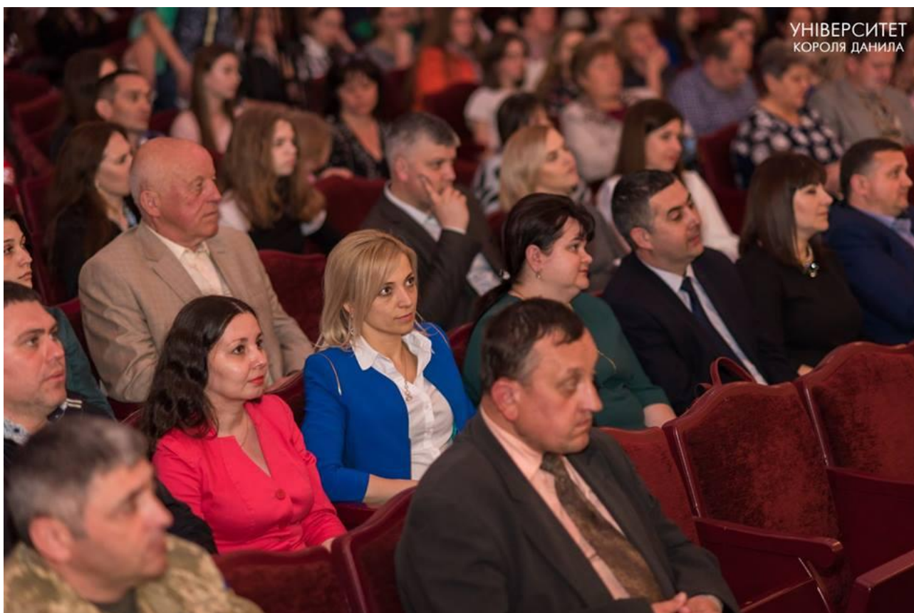
На гала-концерті «Школа має талант-2» у філармонії, 16 квітня 2018 р.