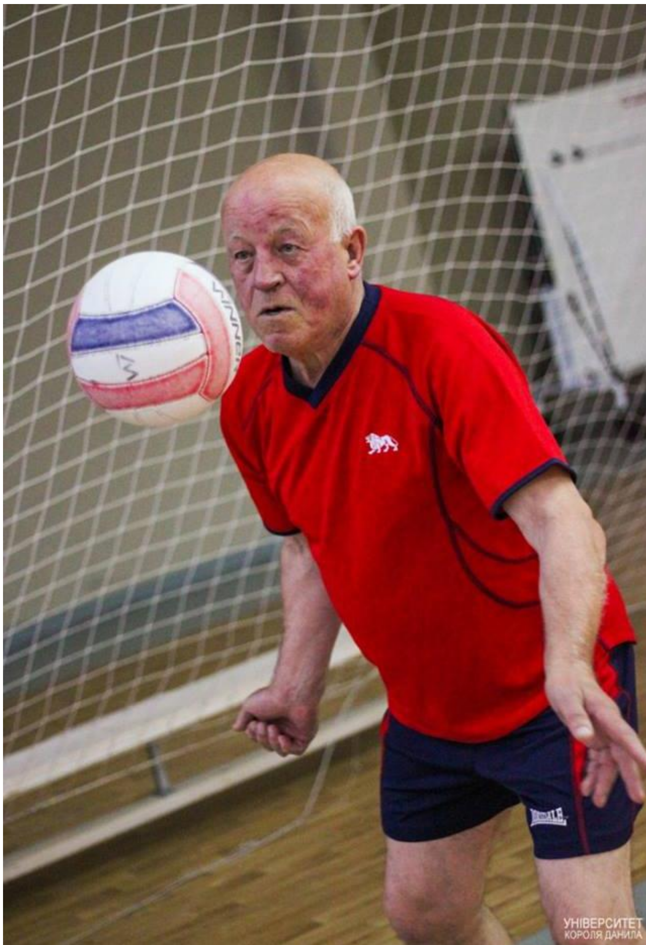
В пориві азарту