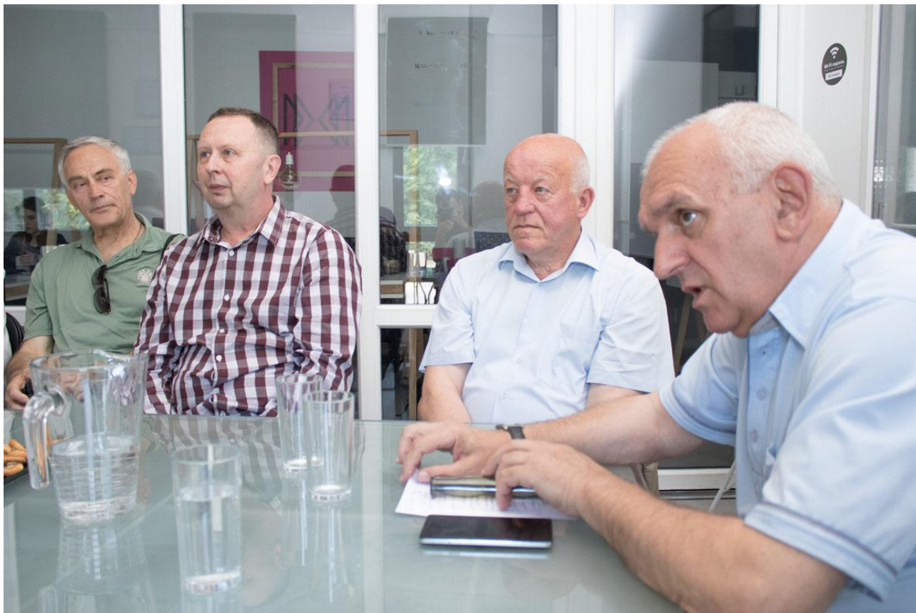
Участь у II Міжнародній конференції з застосування технологій, що захищають здоров'я та життя людини (на прикладі м. Львова, 30-31 травня 2018 р.)