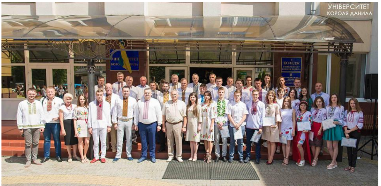
Після вручення дипломів з професорсько-викладацьким складом і студентами-випускниками, 7 липня 2017 року