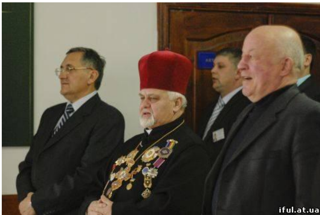
На одному з засідань ректорату, 2012 р.