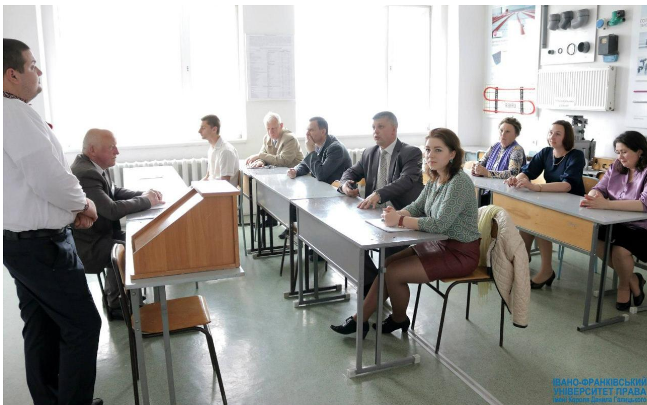
На засіданні секції «Будівництво» в рамках звітної викладацької та студентської науково-практичної конференції «Наука та освіта XXI століття», 7 травня 2015 року.