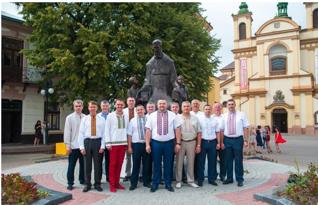
Площа Шептицького. Після вручення дипломів випускникам з професорсько-викладацьким складом університету, 7 липня 2016 р.