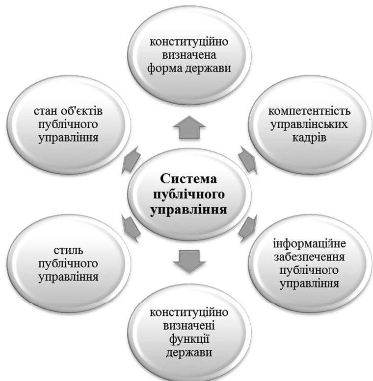
Рис. 1. Фактори, які впливають на побудову системи органів публічного управління

У той же час порівняльні дослідження, безсумнівно, доповнюють і збагачують уявлення про нові форми державного управління, а для країн Центральної та Східної Європи, які перебувають у процесі інституційної трансформації та оновлення, надзвичайно важливим є здійснення таких стратегій, які адаптовані до нових реалій