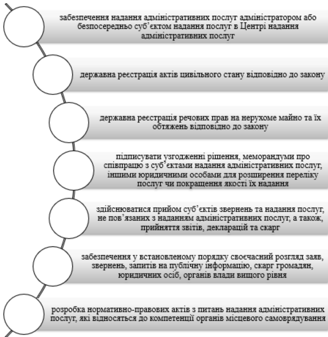
Рис. 1 Основні функції Департаменту адміністративних послуг

Основні функції Департаменту адміністративних послуг зображено на рис. 1.