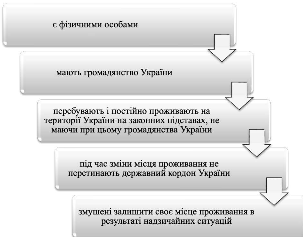
Рис. 1 Ознаки, які характеризують внутрішньо переміщених осіб