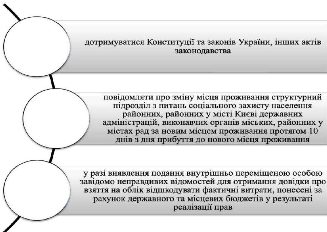
Рис. 3 Обов'язки внутрішньо переміщеної особи

Обов'язки внутрішньо переміщеної особи зображено на рис. 3.