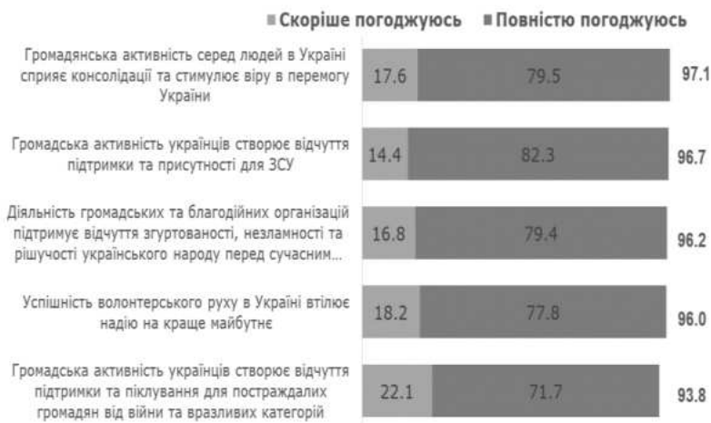
Рис. 2. Частка представників БО/ГО, згодних з висловленнями щодо ролі громадянської активності в Україні під час війни. Примітка: складено автором за [3].

«Громадянське суспільство вийшло на новий рівень: воно ніколи не погодиться жити, як раніше. Українці зрозуміли, що за короткий час можна знайти житло для сотень евакуйованих сімей, приготувати велику кількість гарячої їжі, зібрати сотні тисяч гривень на армійське спорядження, знайти це спорядження і доставити на передову. Тому в майбутньому вони однаково зможуть впливати на всі сфери місцевого та національного життя» [4].