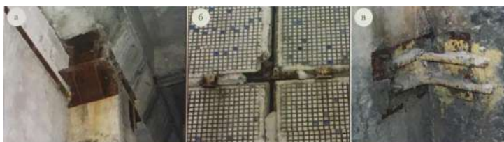
Рис. 1. Закладні деталі вузлів кріплення існуючих конструкцій із слідами корозії:

виконувати перевірочні розрахунки конструкцій з пошкодженнями та визначати залишкові запаси їх міцності або коефіцієнти вичерпання несучої здатності. Процедура розрахунку запасів міцності закладних деталей залізобетонних конструкцій з пошкодженнями відсутня в вітчизняних нормативних документах [1, с. 16].