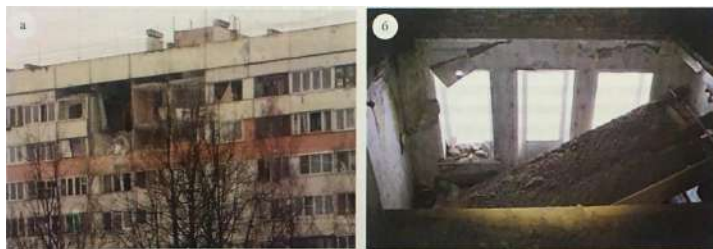
Рис. 2. Обвалення конструкцій внаслідок руйнування закладних деталей:

Співвідношення для виконання перевірочних розрахунків існуючих закладних деталей залізобетонних конструкцій з урахуванням старіння бетону, корозії та тріщин в анкерних на міцність та на опір крихкому руйнуванню, це є метою контролю .