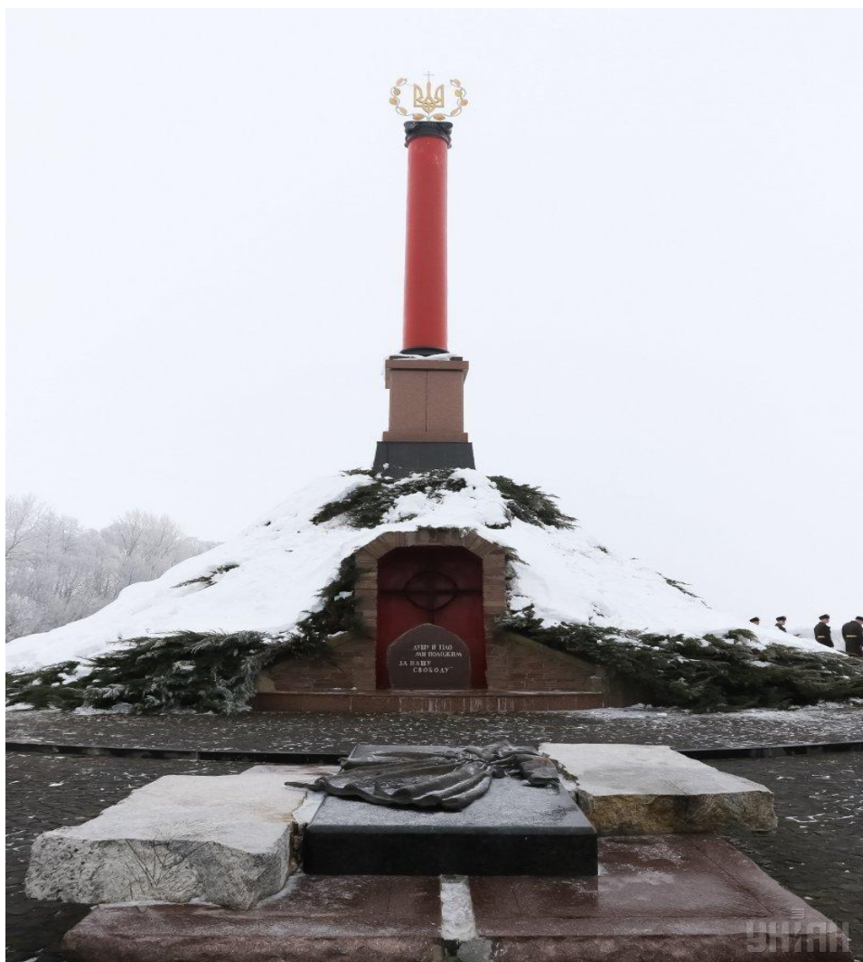
Меморіал пам'яті героїв Крут на Чернігівщині

До 80-річчя подій під Крутами Нацбанк України випустив ювілейну монету номіналом в одну гривню. А в лютому 2019 року у прокат вийшов фільм "Крути 1918", що розповів про героїчну битву українських студентів.