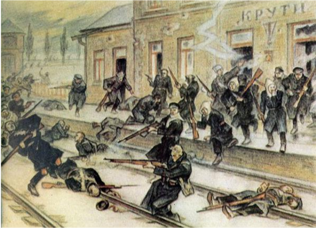
"Бій під Крутами" художника-баталіста Леоніда Перфецького

Та водночас, українське командування отримало тривожні вісті з запілля: курінь ім. Т. Шевченка у Ніжині заявив про підтримку радянської влади. Це загрожувало оборонцям ст. Крути ударом в запілля. Не зволікаючи, А. Гончаренко наказав усім підрозділам відступати. Першою мала відходити до ешелонів студентська сотня, слідом – 2-га, 3-тя і 4-та юнацькі сотні. 1-ша сотня отримала наказ прикривати відступ.