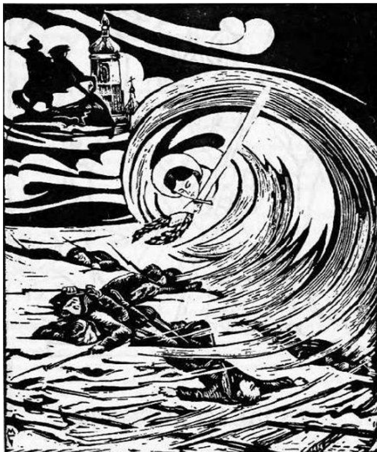
Гравюра на честь Крут, 1935 рік

Згадуючи про подвиг студентів і гімназистів Помічного куреня, чимало сучасників геть забули про подвиг юнаків 1-ї Української військової школи, які винесли на своїх плечах основний тягар бою.