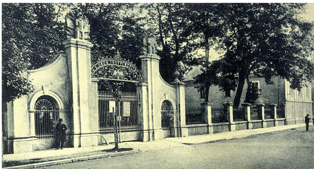
Stanisławów Szpital wojskowy. Станиславів-Шпиталь військовий. Stanislaw. K. u. K. Truppenhospital.