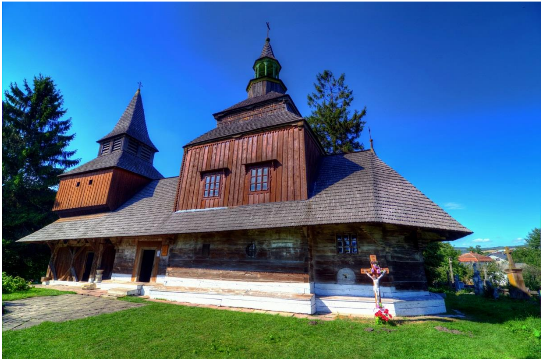
Церква Святого Духа в Рогатині