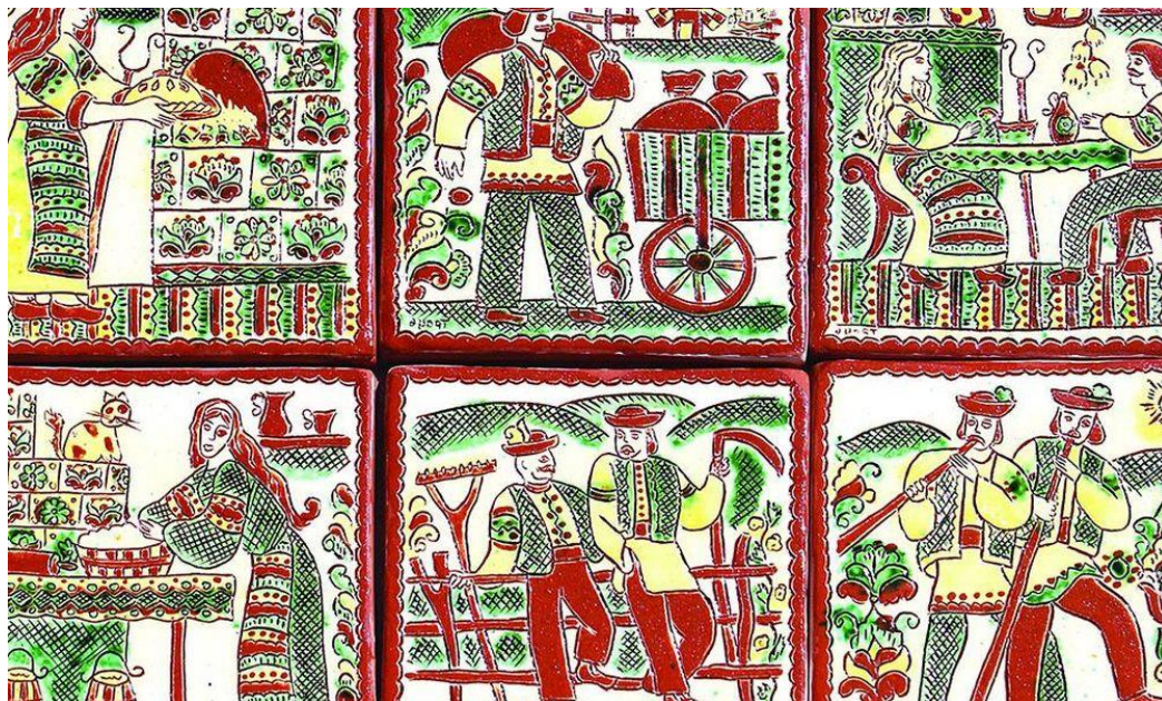
Традиція косівської мальованої кераміки