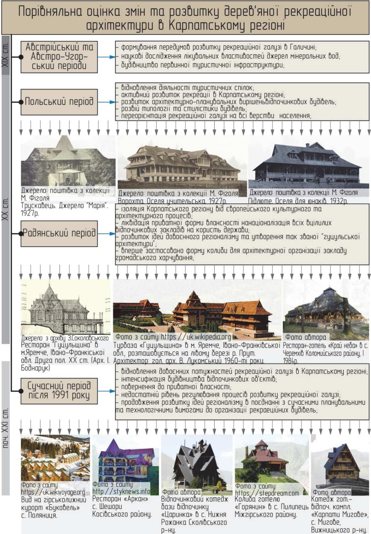
Рис. 2. Порівняльна оцінка змін та розвитку дерев'яних будівель рекреаційної архітектури в Карпатському регіоні (рисунок автора).