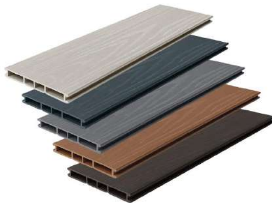
Рис. 1. Терасна дошка типу «PolyWood» [1].

Композитні терасні дошки або терасна дошка типу «PolyWood» це сучасний оздоблювальний матеріал який виготовляється з полімерів (зазвичай поліетилен, поліпропілен або ж інші полімери) та наповнювача (тирса, дерев'яні волокна та інші).