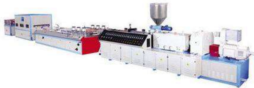
Рис. 3. Лінія для виготовлення композитної терасної дошки [2].

Технологічна лінія для виробництва складається з змішувача та дозатора, екструдера, охолоджувальної системи, транспортера, різальної машини та укладального механізму.