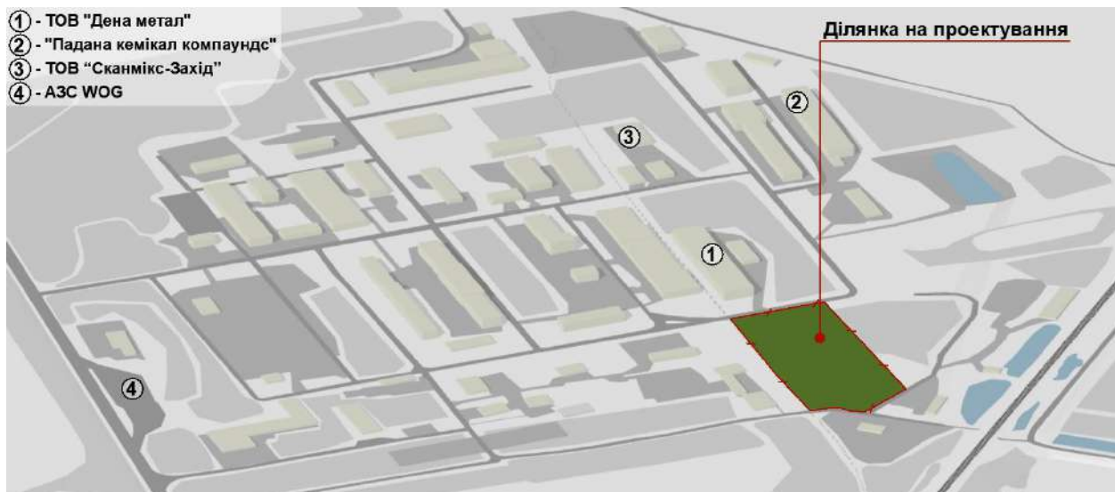
Рис. 4. Територія ТОС «Барва» та ділянка для проектування і будівництва.

Підприємство включає в себе виробничі приміщення для організації технології виробництва, лабораторії для перевірки якості продукції, складські приміщення для сировини та готової продукції, відділення для підготовки сировини, адміністративне приміщення та торговий простір для демонстрації та продажу продукції.