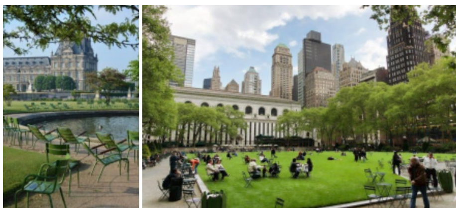
рис. 1.2 а) сад Тюільрі, Париж, Франція; б) Брайант парк, Нью-Йорк, США

призначенням. При створенні громадських просторів треба вивчати потреби людей, які безпосередньо будуть ними користуватися. [2]