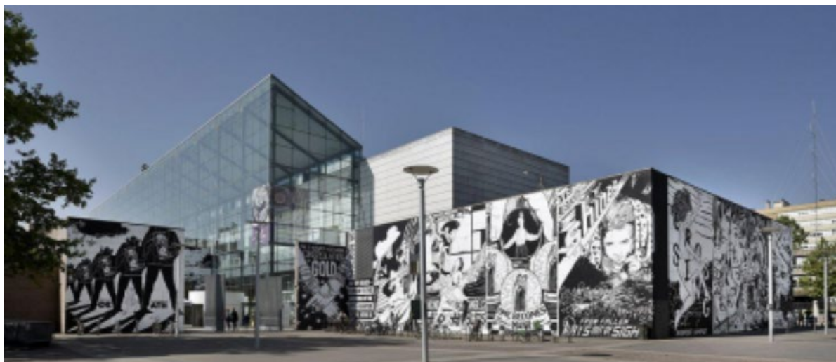
рис. 1.8 Музей сучасного мистецтва у м. Страсбург

Довжина центрального скляного холу 104м. та його внутрішня висота 22м.