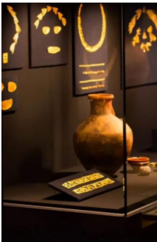
рис. 1.5 Скіфське золото

Історія створення музеїв почалася ще 2000 р до не у Стародавньому світі , Коли почали збирати літературні тексти написані на глиняних табличках, тоді виникли бібліотеки (7 ст. до н.е.). Пізніше у часи античності з дарів що приносились у музей для жертвоприношення музам (які вважались божествами джерел, а пізніше - покровительками мистецтв і наук), створювалися перші колекції. Богам присвячувались предмети декоративно-прикладного мистецтва, статуї, реліквії, військові трофеї у надії отримати зцілення чи задовольнити будь-яке прохання. Ці дари зберігалися в святилищах, храмах, скарбницях.