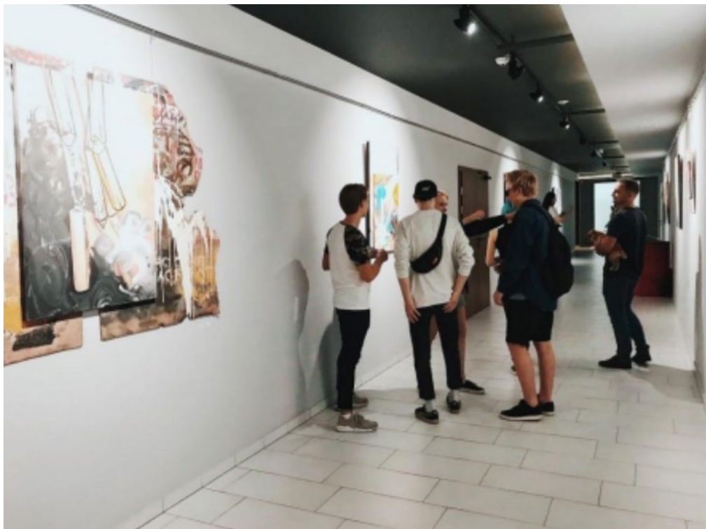
рис. 1.3 Арт-простір “коридор”, Луцьк [22]

громадськості та спілкуватися з іншими художниками та шанувальниками мистецтва. Також арт-простором є мистецькі студії, виставкові приміщення, музеї чи інші культурні простори. Сюди входять і приміщення, де художники чи інші митці можуть працювати над своїми творами індивідуально чи колективно, простори для показу цих робіт. Місця, де проводяться виставки, виступи, концерти, лекції та інші культурні події. Отже, арт-простір може бути будь-яким місцем, де мистецтво стає доступним та сприяє розвитку творчості та культурного життя.