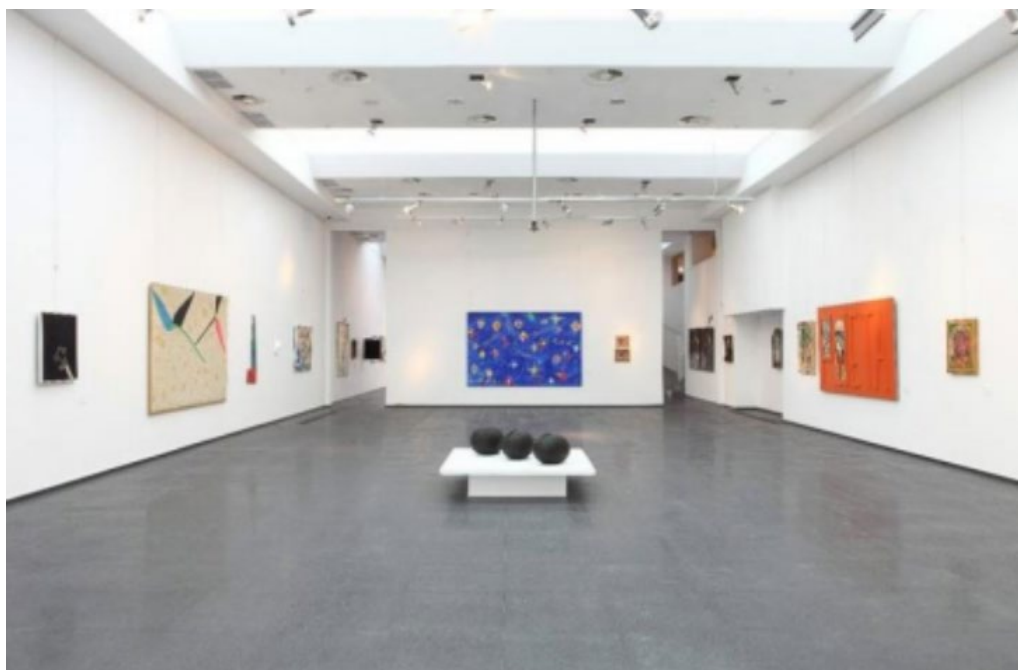
рис 1.4 картинна галерея у центрі сучасного мистецтва М17, Київ [23]

Тобто: галерея художня - споруда, де зберігаються і експонуються твори станкового і декоративно-ужиткового мистецтва. Характерна анфіладним розплануванням просторих залів, влаштуванням ліхтарів для верхнього освітлення і репрезентативним зовнішнім виглядом. [3]