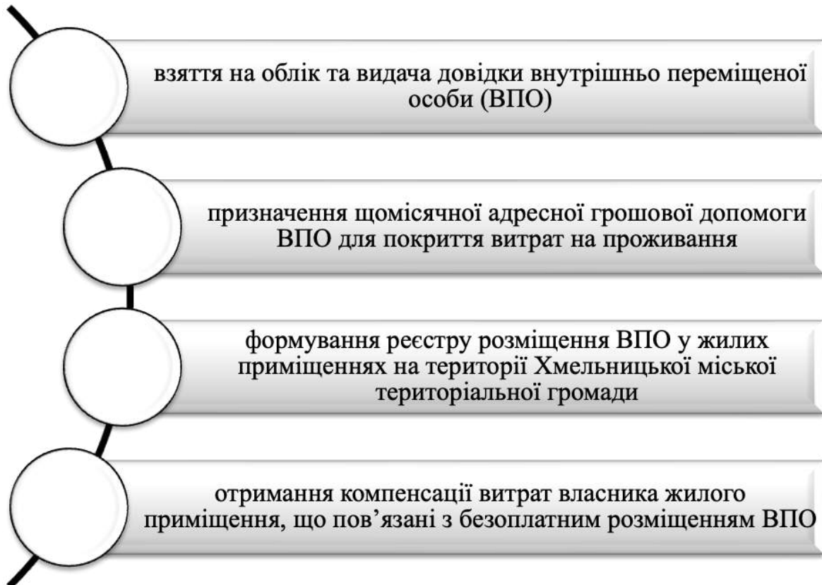
Рис. 4 Комплекс послуг для внутрішньо переміщених осіб та власників житла, де вони проживають, які надаються Хмельницьким ЦНАП.

Комплекс послуг для внутрішньо переміщених осіб та власників житла, де вони проживають, які надаються Хмельницьким ЦНАП зображено на рис. 4.